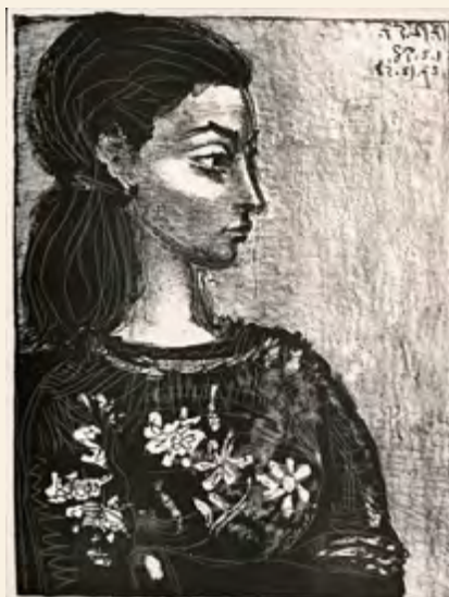
Mujer con blusa de flores.