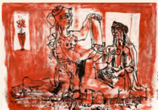
Mujer ante un espejo.

' Picasso: El eterno femenino ' se ha hecho posible gracias al préstamo de las obras por parte de la Fundación Picasso. Museo Casa Natal de Málaga. "El artista siempre tuvo una especial relación con las mujeres . Esa relación se convirtió en arte a lo largo de toda su vida. El influjo de su tía, su abuela y, sobre todo de su madre, con las que vivió, está presente en su creación", asegura José María Luna, director de la institución con sede en Málaga.